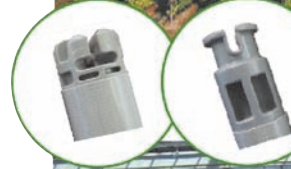
左:エンドキャップ A 右:エンドキャップ B